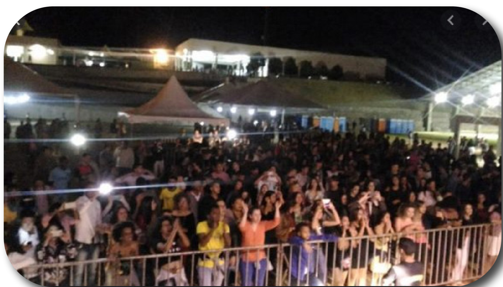
Aniversário do Câmpus com Show da banda Exalta Samba durante o FEPTEC – IFG Câmpus Luziânia 2018

Realização o primeiro Fórum de Educação Profissional do IFG Câmpus Luziânia (FEPTEC) 2018, evento com captação de recursos externos, com caráter formativo, científico e cultural contou com a participação de mais de 600 pessoas e palestras com pesquisadores renomados do Brasil.