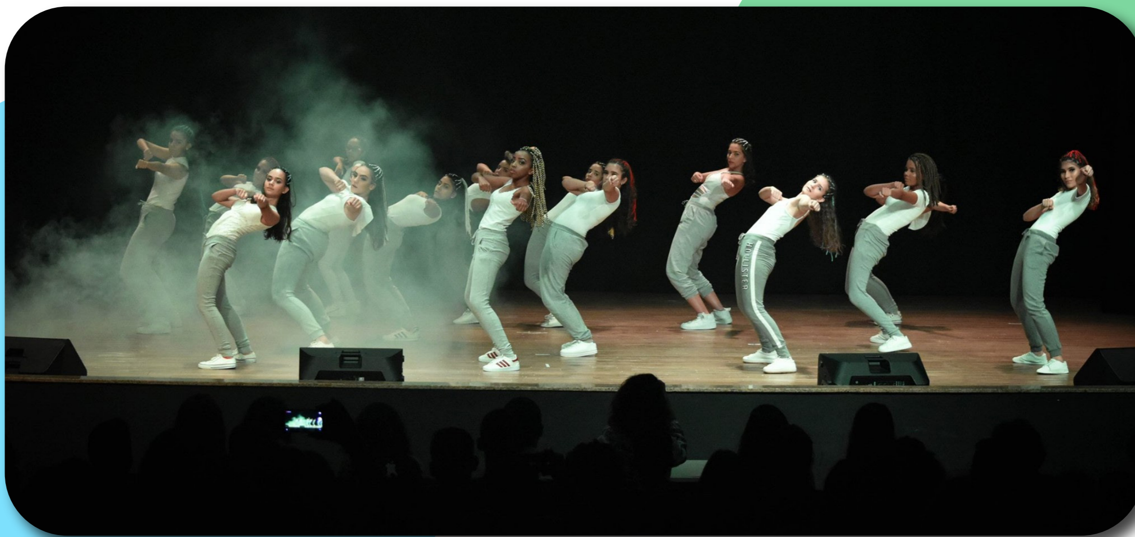
APRESENTAÇÃO DE DANÇA (2019) – TURMAS DO TÉCNICO INTEGRADO, DISCIPLINA DE EDUCAÇÃO FÍSICA.

Portanto, nosso compromisso é continuar na busca de recursos externos, melhorando e viabilizando ações que melhorem nossa infraestrutura, tais como: