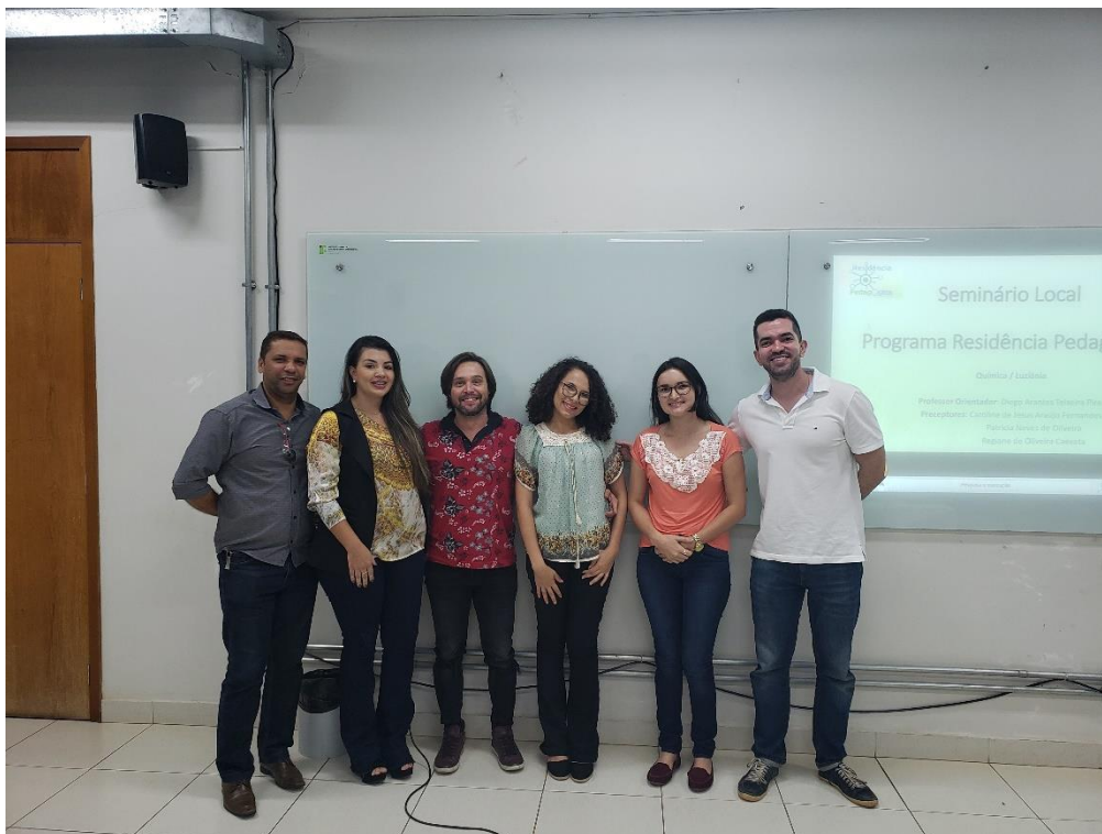
Foto 08: Equipe PRP/IFG - Subprojeto: Química – Câmpus/Núcleo Luziânia

MINISTÉRIO DA EDUCAÇÃO SECRETARIA DE EDUCAÇÃO PROFISSIONAL E TECNOLÓGICA INSTITUTO FEDERAL DE EDUCAÇÃO, CIÊNCIA E TECNOLOGIA DE GOIÁS PRÓ-REITORIA DE ENSINO DIRETORIA DE POLÍTICAS EM EDUCAÇÃO BÁSICA E SUPERIOR PROGRAMA DE RESIDÊNCIA PEDAGÓGICA COORDENAÇÃO INSTITUCIONAL