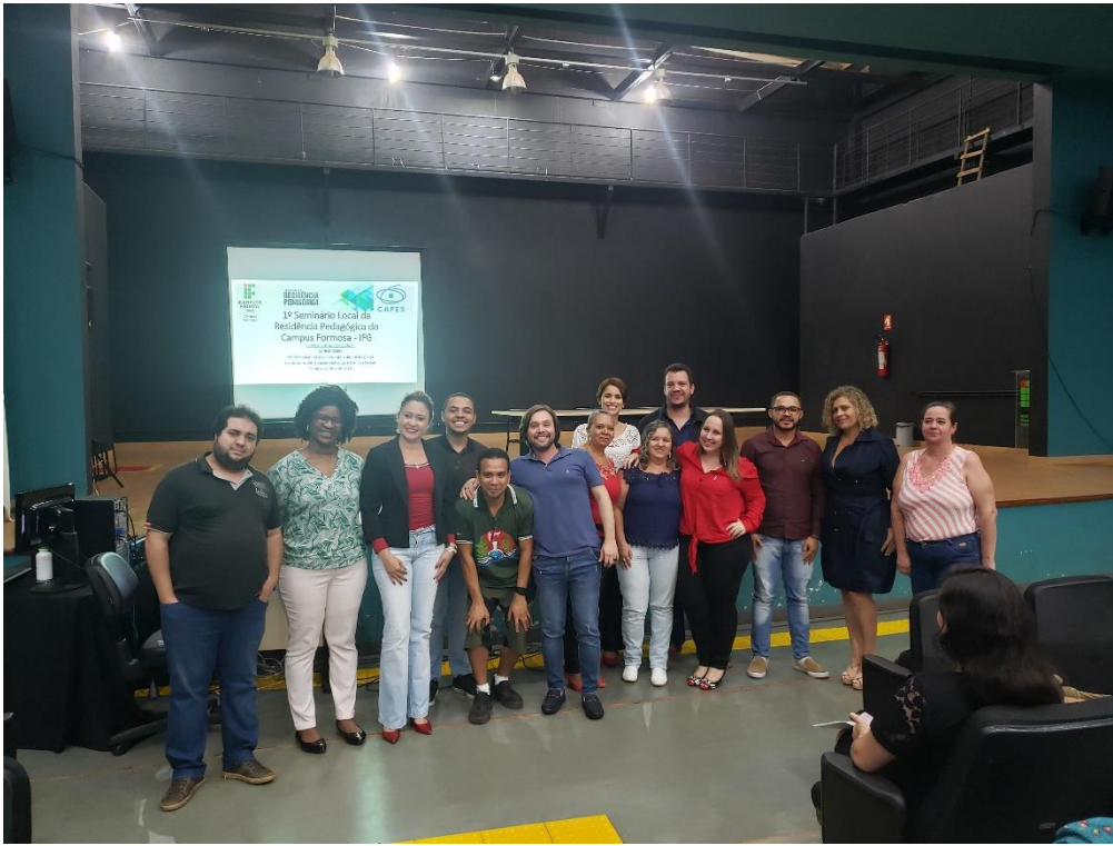
Foto 01: Equipe PRP/IFG – Subprojetos: Biologia e Sociologia – Câmpus Formosa

MINISTÉRIO DA EDUCAÇÃO SECRETARIA DE EDUCAÇÃO PROFISSIONAL E TECNOLÓGICA INSTITUTO FEDERAL DE EDUCAÇÃO, CIÊNCIA E TECNOLOGIA DE GOIÁS PRÓ-REITORIA DE ENSINO DIRETORIA DE POLÍTICAS EM EDUCAÇÃO BÁSICA E SUPERIOR PROGRAMA DE RESIDÊNCIA PEDAGÓGICA COORDENAÇÃO INSTITUCIONAL